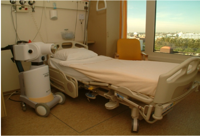
Kamer op F5Noord

Tijdens de operatie moet het laatste stuk van uw darmen leeg zijn. Daarom krijgt u 's avonds op de verpleegafdeling een middel (klyisma) om de darmen leeg te maken.