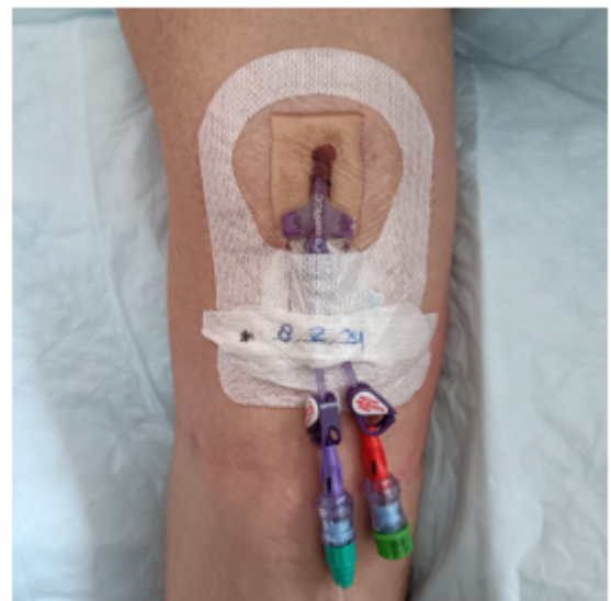
Een bovenarm met een PICC

Na het inbrengen van de lijn zullen 1, 2 of 3 kleine slangetjes (lumen) zichtbaar zijn aan de binnenkant van uw bovenarm. Op een lumen kan een infuuslijn of bloedafnamebuis worden aangesloten.