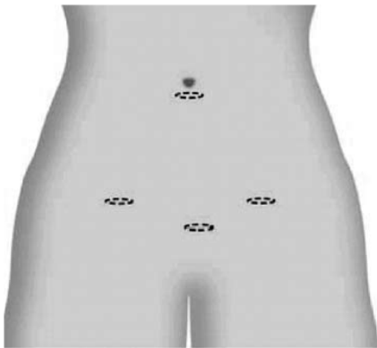
Figuur 1. Littekens na een baarmoederverwijdering door middel van een kijkoperatie.

Deze operatietechniek wordt gebruikt als alleen de baarmoeder wordt verwijderd of als de baarmoeder in combinatie met de eierstokken wordt verwijderd. Bij deze techniek maakt de gynaecoloog drie tot vier sneetjes in de buikwand (zie figuur 1). Via een snee net onder de navel wordt een kijkbuis in de buik gebracht; via de andere sneetjes brengt men instrumenten in de buikholtte waarmee de baarmoeder (en eventueel de eierstokken) worden losgemaakt. Aan het einde van de operatie wordt de baarmoeder via de vagina verwijderd.