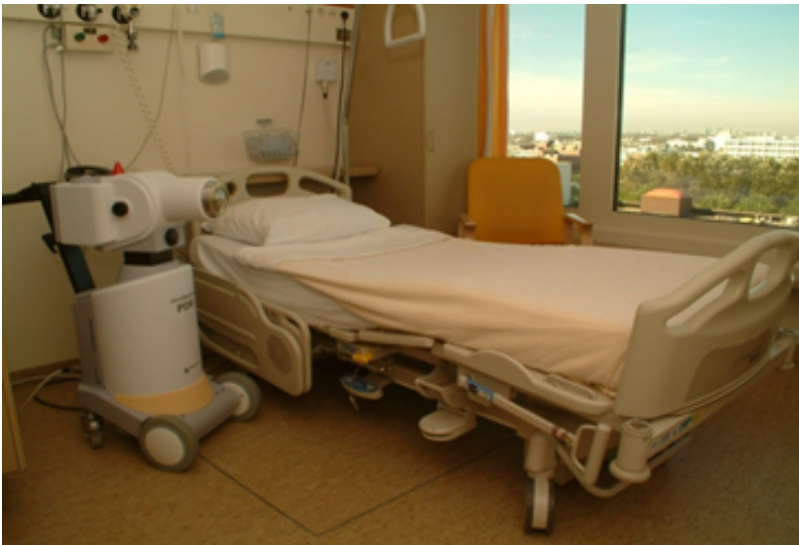
Kamer op F5Noord

Indien u vroeg in de ochtend op de operatie kamer moet zijn wordt u de avond voor de inwendige bestraling opgenomen op de afdeling F5-Shortstay/Bestralingsunit van het Amsterdam UMC locatie AMC.