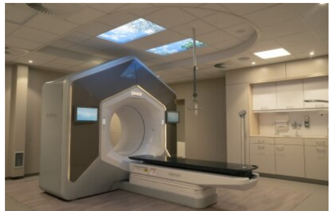
Voorbeelden van bestralingsapparaten