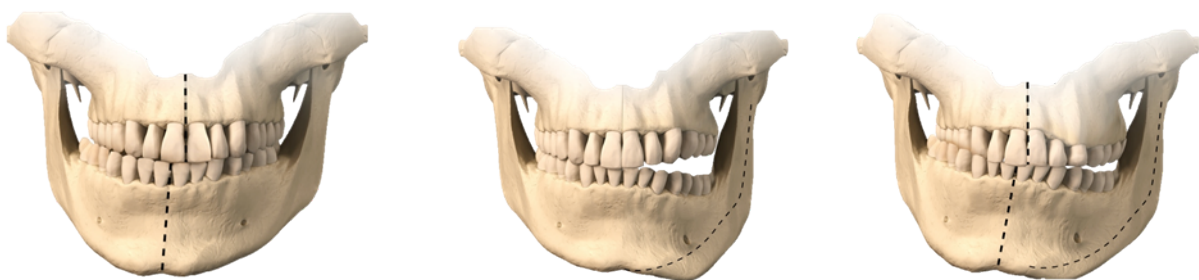
Figuur 1: voorbeelden van de verschillende vormen van UCH