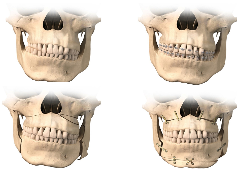
Figuur 4: gecombineerd orthodontisch-chirurgisch traject