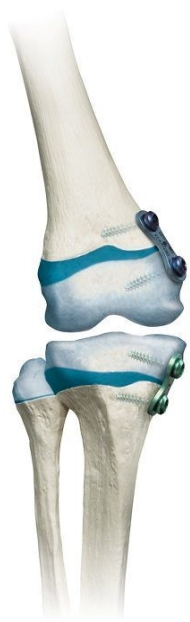
Na verwijderen 8 plates