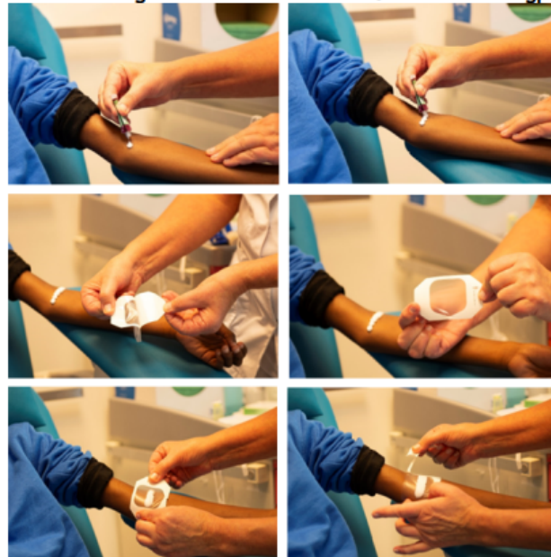
Het aanbrengen van de Emla crème® in de elleboogplooi: