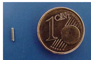
Jodium 125 zaadje