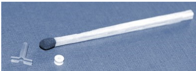
Figuur 1: trommelvliesbuisje

Een trommelvliesbuisje is een buisje, meestal gemaakt van kunststof, met de grootte van een halve luciferkop. De doorsnede is ongeveer 1,5 mm en de lengte varieert van 3 mm tot 12 mm. Er zijn verschillende typen, die in vorm, afmeting en kleur kunnen variëren. Een veelgebruikt type is hier naast afgebeeld.