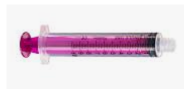
ENFit® 10ml spuit

Gebruik hiervoor de ENFit® spuit (paars)