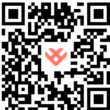
QR-code AppStore (Apple)

U kunt de Kardia-app downloaden in de App Store (iOS/Apple) of de Play Store (Android). Hier kunt u de app makkelijk vinden door te zoeken op 'Kardia'. U kunt ook onderstaande QR-code scannen (passend bij uw besturingssysteem) om direct de app te downloaden