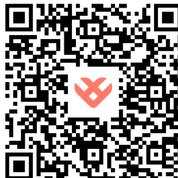
QR-code Play Store (Android)

Mocht het niet lukken om de Kardia-app te vinden, dan kan dat te maken hebben met het volgende: