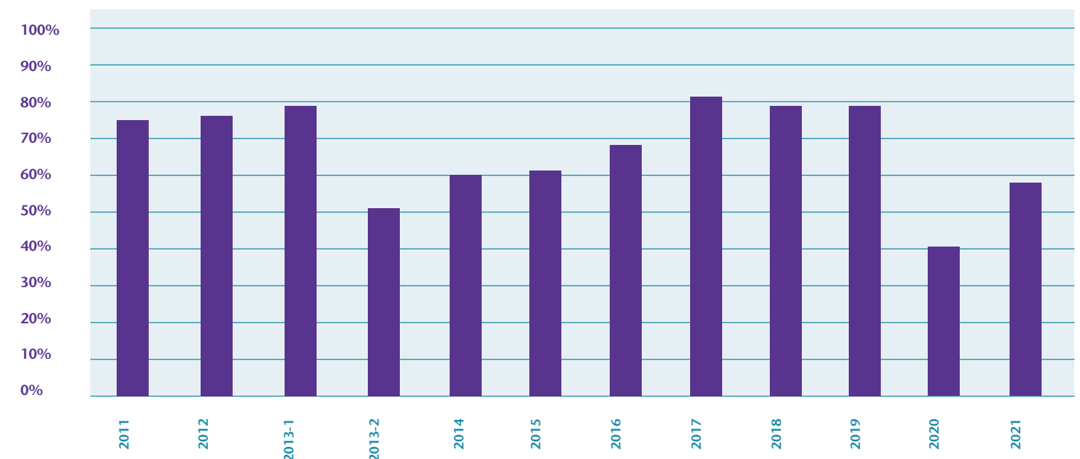
Gemiddelde kamerbezetting 2011 t/m 2021

In 2021 kwam het aantal overnachtingen uit op 5.348. In 2020 kwam dit aantal uit op 3.517. In 2021 maakten 8.301 gasten gebruik van het Gastenverblijf. Dit waren er in het vorige verslagjaar 5.440. In 2021 waren 33 dagen alle 25 kamers bezet. In 2020 was dit 29 dagen het geval. Aan deze getallen kan worden afgeleid dat we ook in dit verslagjaar nog veel last hadden van de coronapandemie in tegenstelling tot de periode vóór de coronapandemie in 2020 (toen: januari ruim 84% en februari ruim 96%).